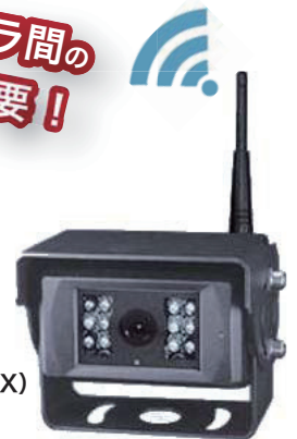
◆WR-C15ML マイクロフォン 赤外線付カメラ(TX)