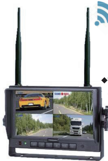
◆WR-D754 4カメラ受信対応 無線モニター(RX)